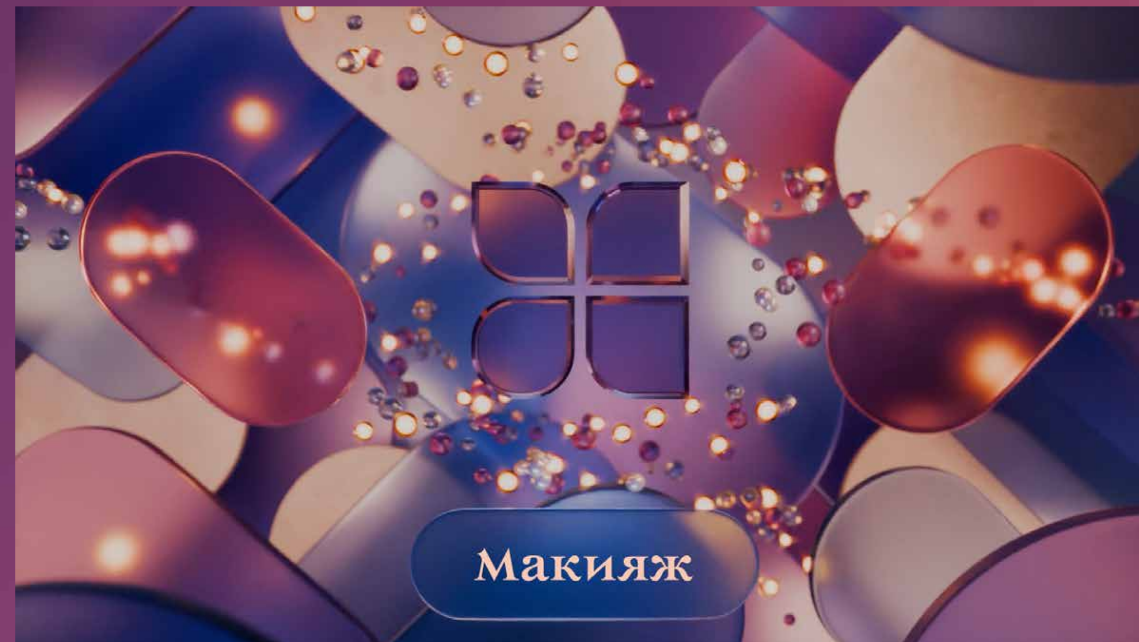
Заставка передачи 2