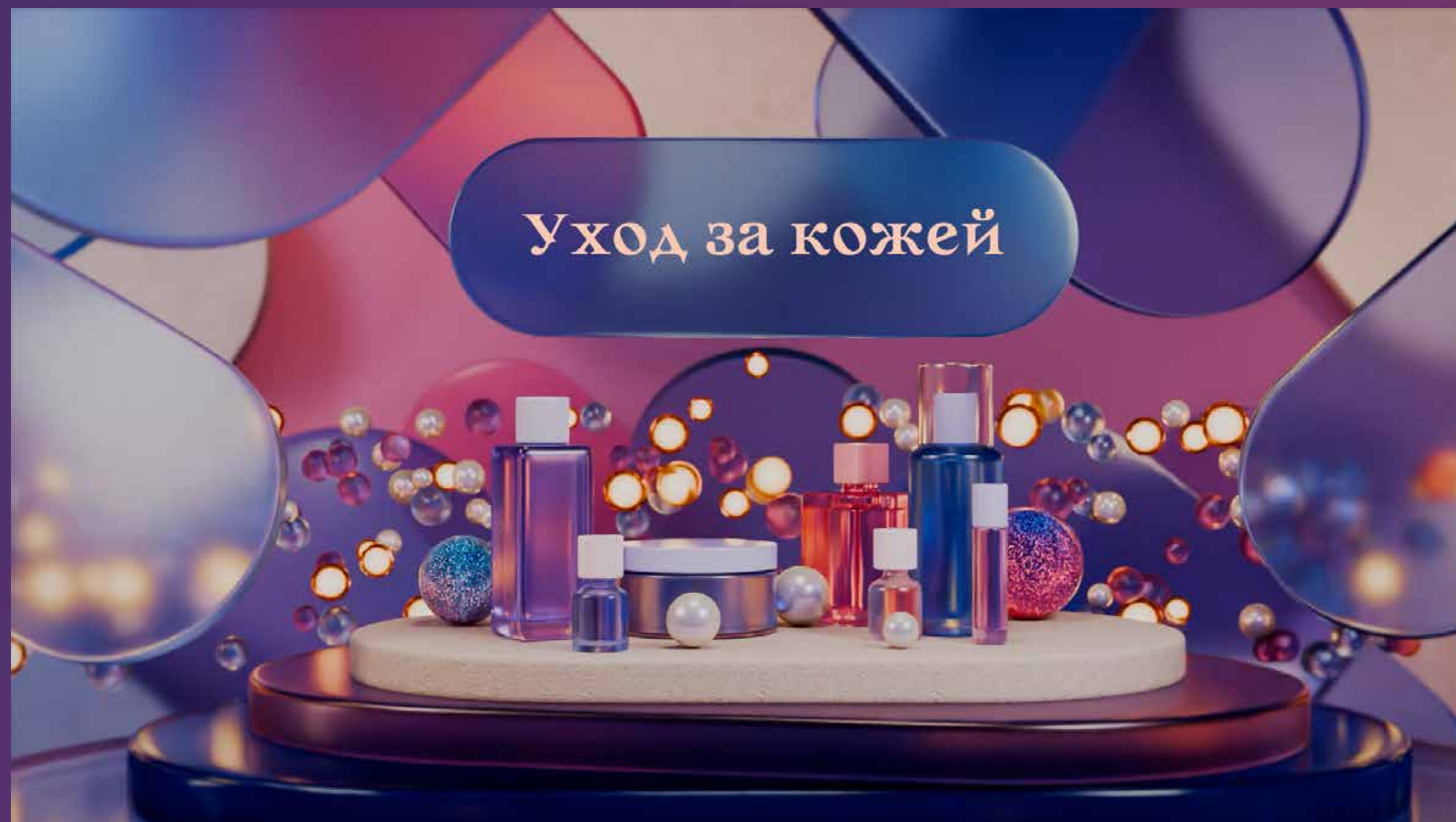
Заставка передачи 1