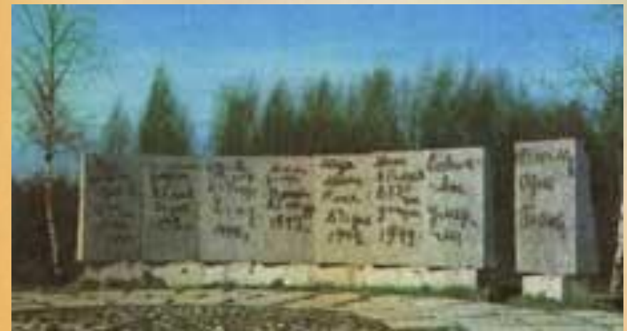
Мемориальный комплекс Дневник Тани Савичевой