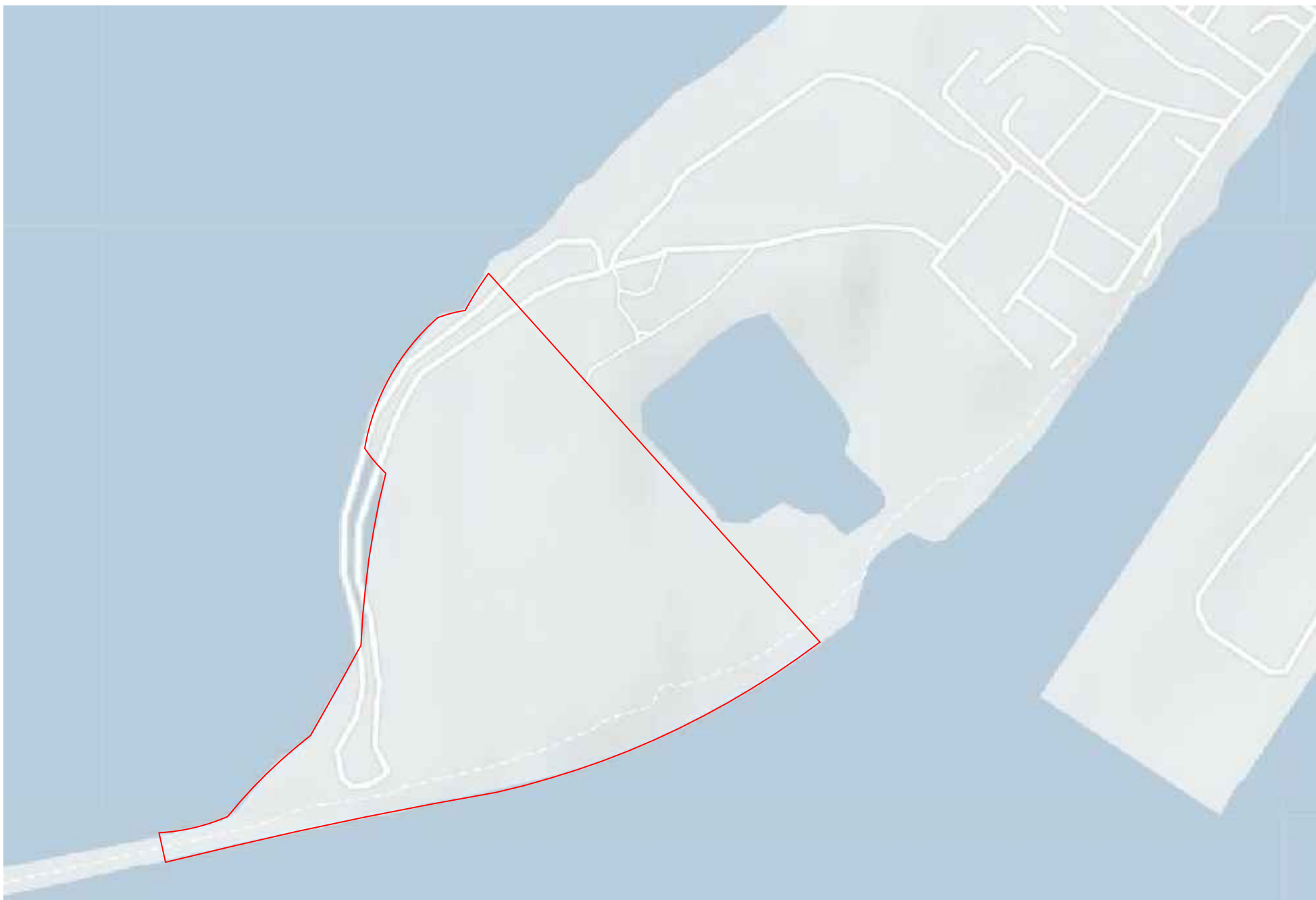
Ситуационный план М 1:3500