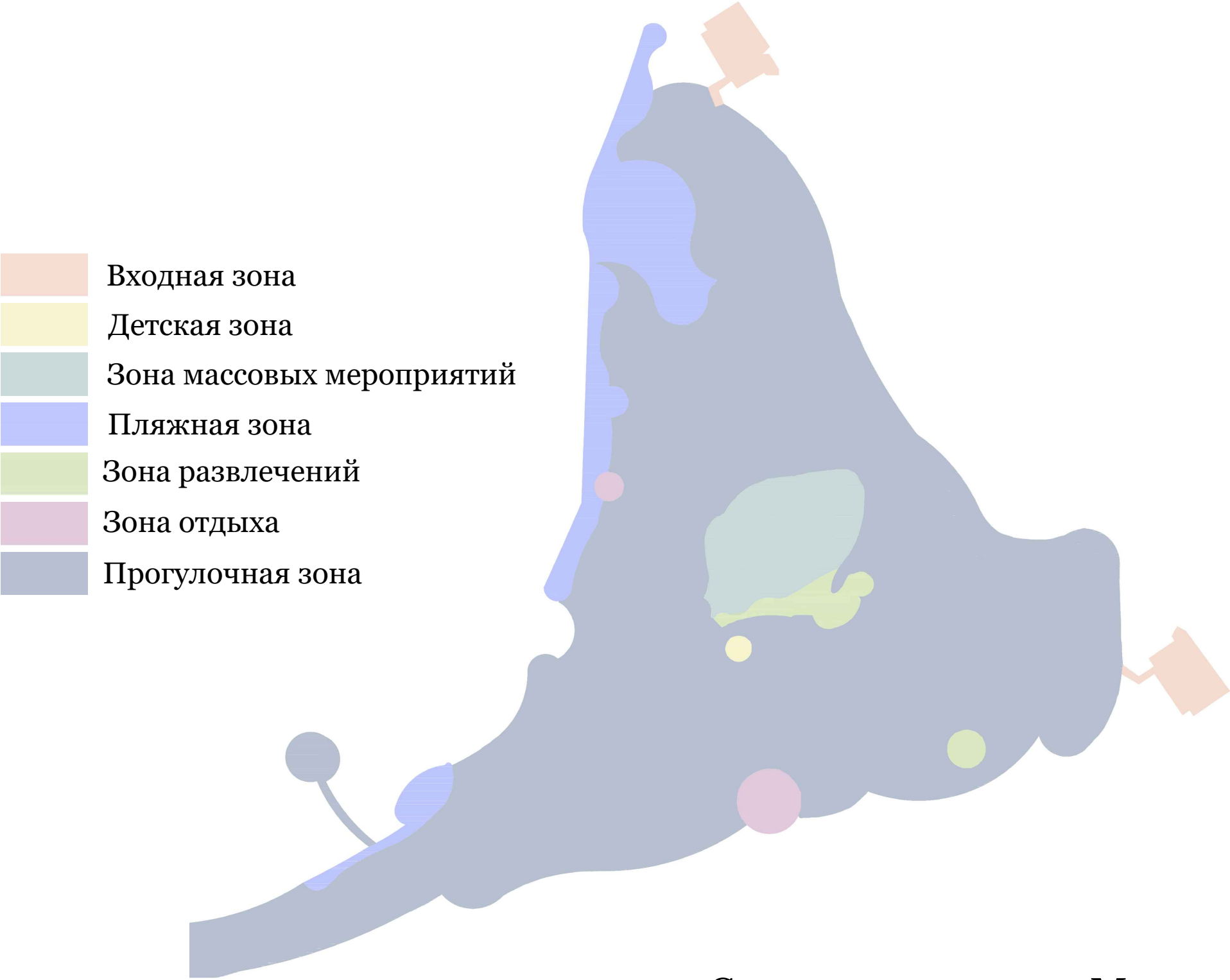
Схема зонирования М 1:2500