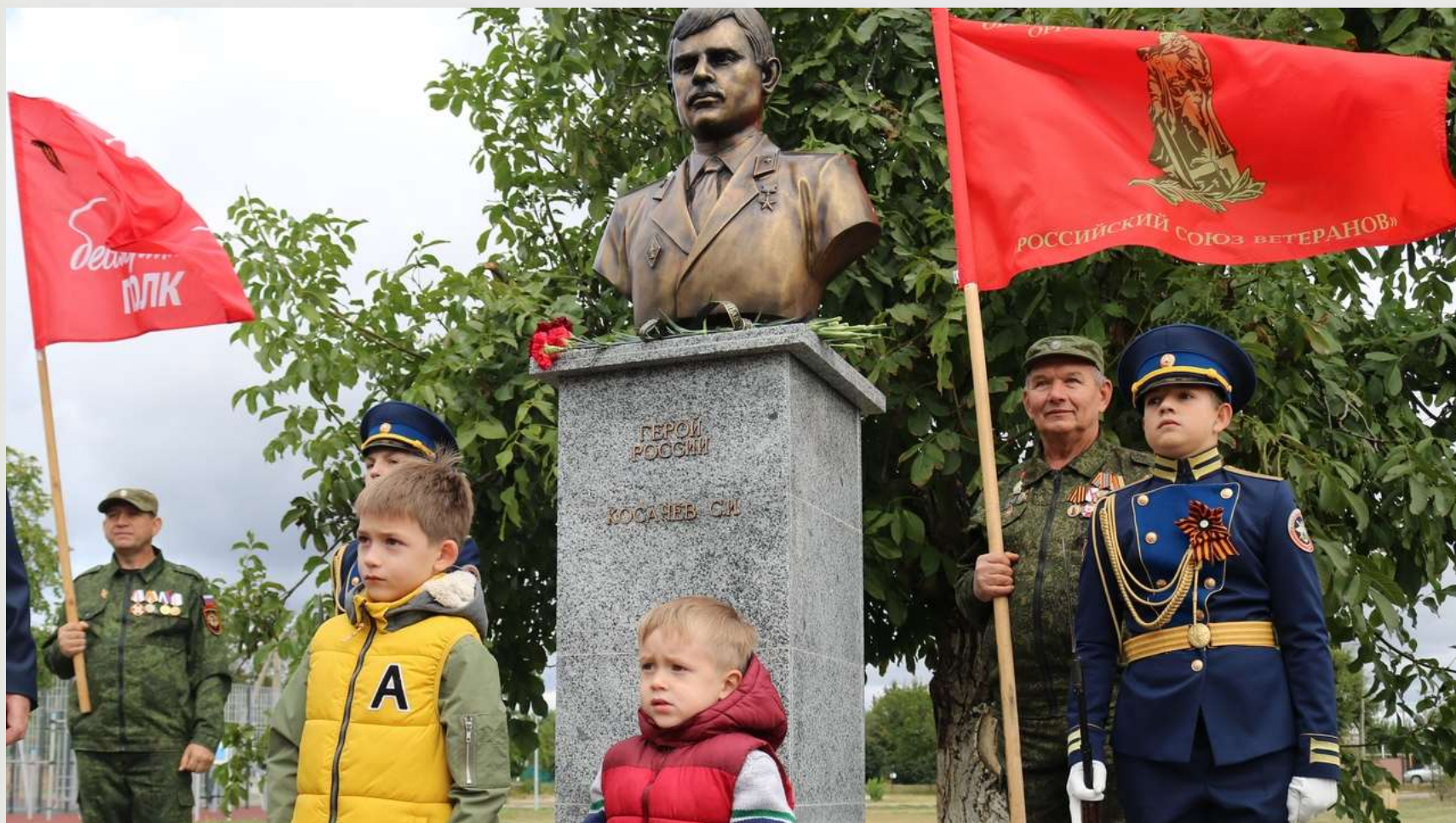
Внуки С.И. Косачева возле бюста героя в пгт. Октябрьское